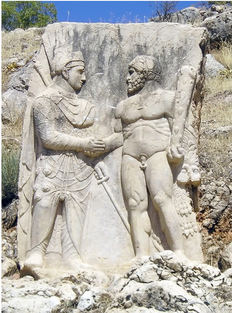
Antiochos a Herakles